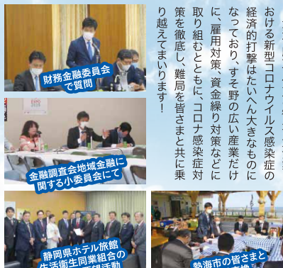
財務金融委員会で質問

沼津・駿東伊豆の観光・飲食業における新型コロナウイルス感染症の経済的打撃はたいへん大きなものになっており、すそ野の広い産業だけに、雇用対策、資金繰り対策などに取り組むとともに、コロナ感染症対策を徹底し、難局を皆さまと共に乗り越えてまいります!