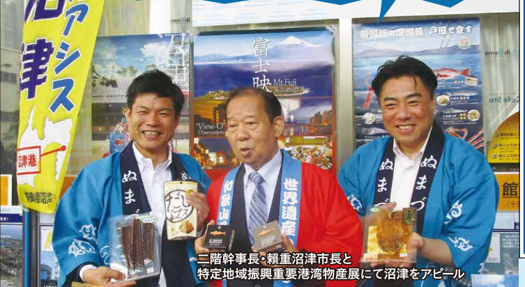
二階幹事長・頼重沼津市長と 特定地域振興重要港湾物産展にて沼津をアピール