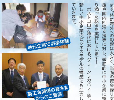
地元企業で溶接体験

コロナ禍における世界経済の大打撃により、ふるさととの中小企業の経済的影響も大きなものになっています。特に海外への影響は大きく、当面の資金繰り支援や国内回帰支援等に対し、徹底的に中小企業に寄り添った政策を実行していきます!