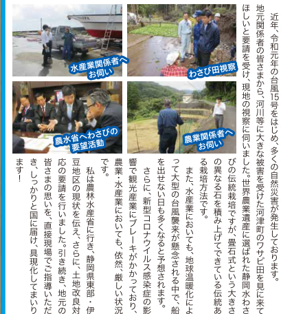
水産業関係者へお問い合わせ

近年、令和元年の台風15号をはじめ、多くの自然災害が発生しております。地元関係者の皆さまから、河川等に大きな被害を受けた河川のワジ田田舎に来てほしいと要望を受け、現地の漁師に伺いました。世界遺産に選ばれた静岡水わさびの伝説栽培ですが、嵐石という大きな異なる石を積み上げてきている伝統ある栽培方法です。また、水産業においても、地球温暖化によって大型の台風襲来が懸念される中で、船を出さない日が多くなると懸念されます。さらに、新型コロナウイルス感染症の影響で観光産業が冷え込んでいる中で、農業・水産業においても、依然、厳しい状況です。私は農林水産省に行き、静岡県農産部・伊豆地区の現状を伝え、さらに、土地改良対応の講義を行いました。引き続き、地元の方々の思いを、直接現場でご確認いただき、しっかりと国に届け、具現化してまいります!