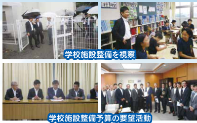
学校施設整備を視察

コロナ禍において、小中学校の全校休校により夏の登校日が増え、普通教室のエアコン設置における多くの感謝の言葉をいただきました。さらに、こうした感染症による休校だけでなく、地震や台風等の災害による休校等、子供たちの教育が遅れることのないよう、ICTによる遠隔教育の普及と力を入れています。