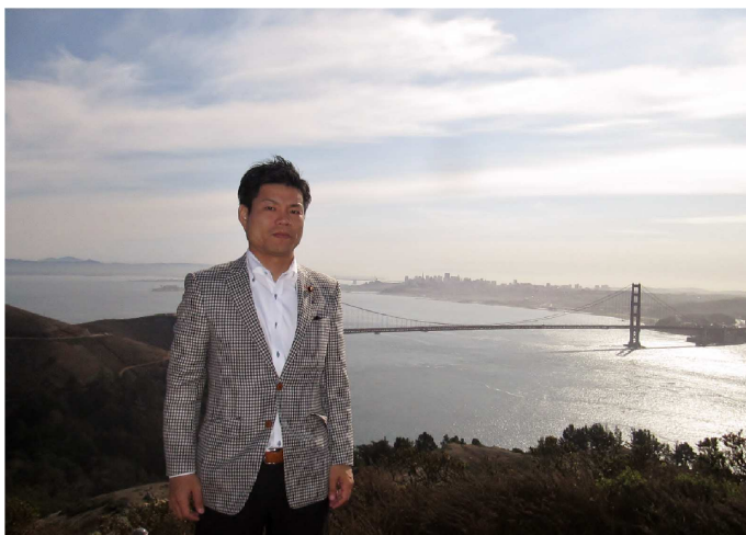
ゴールデンゲートブリッジにて