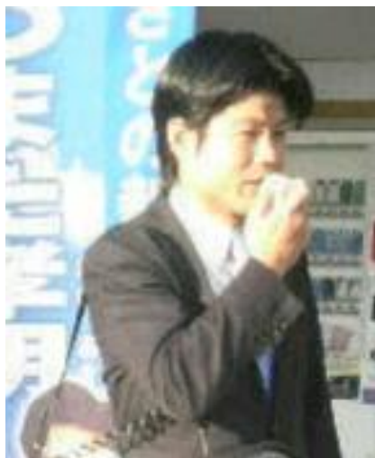
ある日の朝の街頭演説にて！